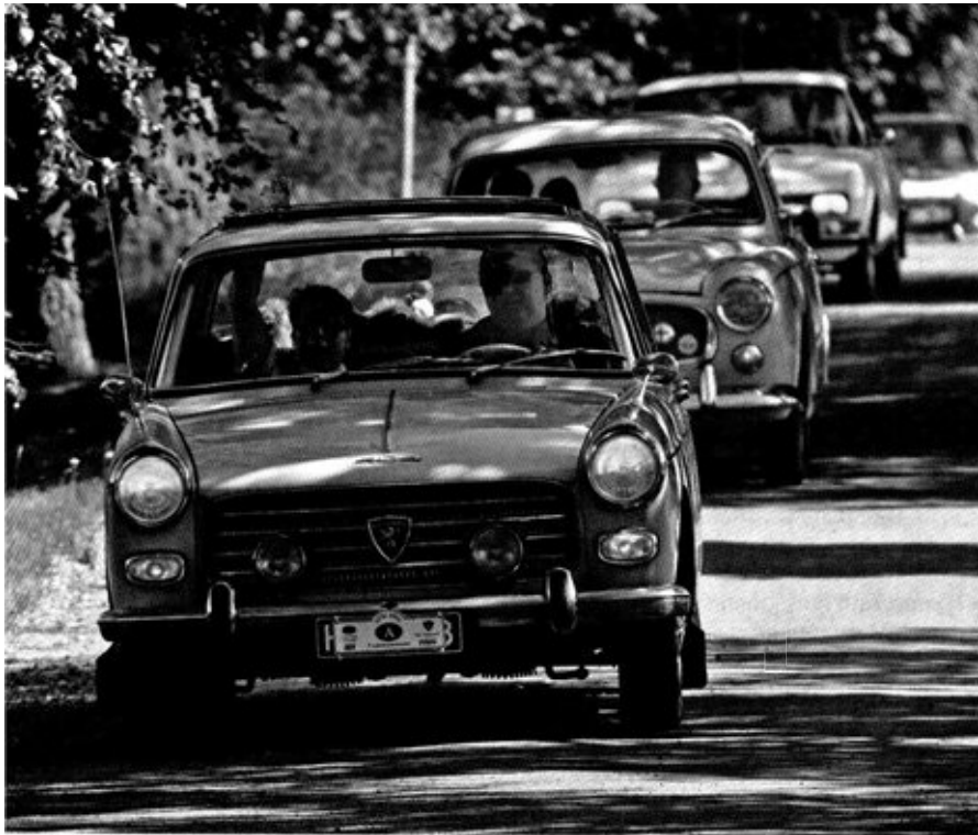
1 Auch Oldies müssen auf finnischen Straßen stets mit Licht fahren 2 Zum schönsten Auto gekürt: 402 Cabriolet aus Deutschland 3 Aus dem Fundus des Peugeot-Museums: 601 Limousine 4 Schmuckstück von Pininfarina: 504 Coupé 5 Kein Etiketten-Schwindel: Aufkleber-Parade an einem 404 6 Für größeres Gepäck geeignet: 203 mit Anhänger 7 Farbliches Idyll: Finnisches Holzhaus als Kulisse für Peugeot-Klassiker